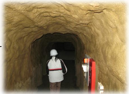
沖縄陸軍病院南風原壕