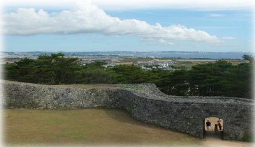
座喜味城址と米軍基地